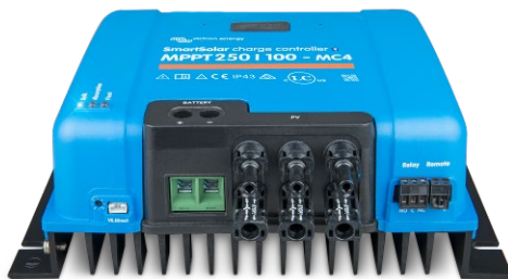
SmartSolar-Lade-Regler MPPT 150/100-MC4 ohne Display