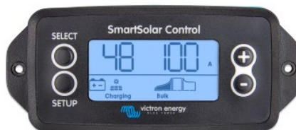
Einsteckbares SmartSolar display