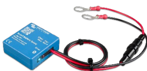
Bluetooth-Erkennung: Smart Battery Sense