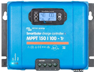
SmartSolar-Lade-Regler MPPT 150/100-Tr mit optionalem einsteckbarem Display