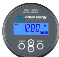
Bluetooth-Erkennung: BMV-712 Smart Battery Monitor