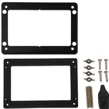
Zubehör im Lieferumfang des GX Touch 50